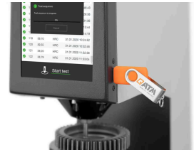
デジタルデータ出力

安定した超精密なローラーベアリング式スピンドルガイドを採用。堅牢でメンテナンスフリーの構造です。ロックウェル硬さ試験機には、 \varnothing 25\text{mm} のテーブルマウントが用意されています（オプションで \frac{3}{4} インチのアダプターも利用可能）ので、さまざまな試験台や装置を使用することができます。