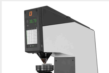
コンパクトデザイン - 最新テクノロジー