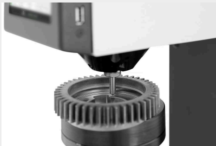
着脱可能なダウンホルダー

テストポイントにアクセスできないために、長時間の段取り替えをする必要はありません。クランプヘッドは2本のネジで取り外すことができます。これにより、手の届かない場所にあるテストポイントにも簡単にアクセスできます。