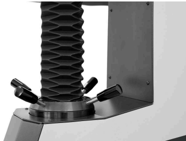
テストテーブルの高さ調整

ロックウェル硬さ試験機の前面にあるスタートボタン（特に手袋を着用している場合）やタッチスクリーン操作により、簡単かつ迅速にスタートすることができます。